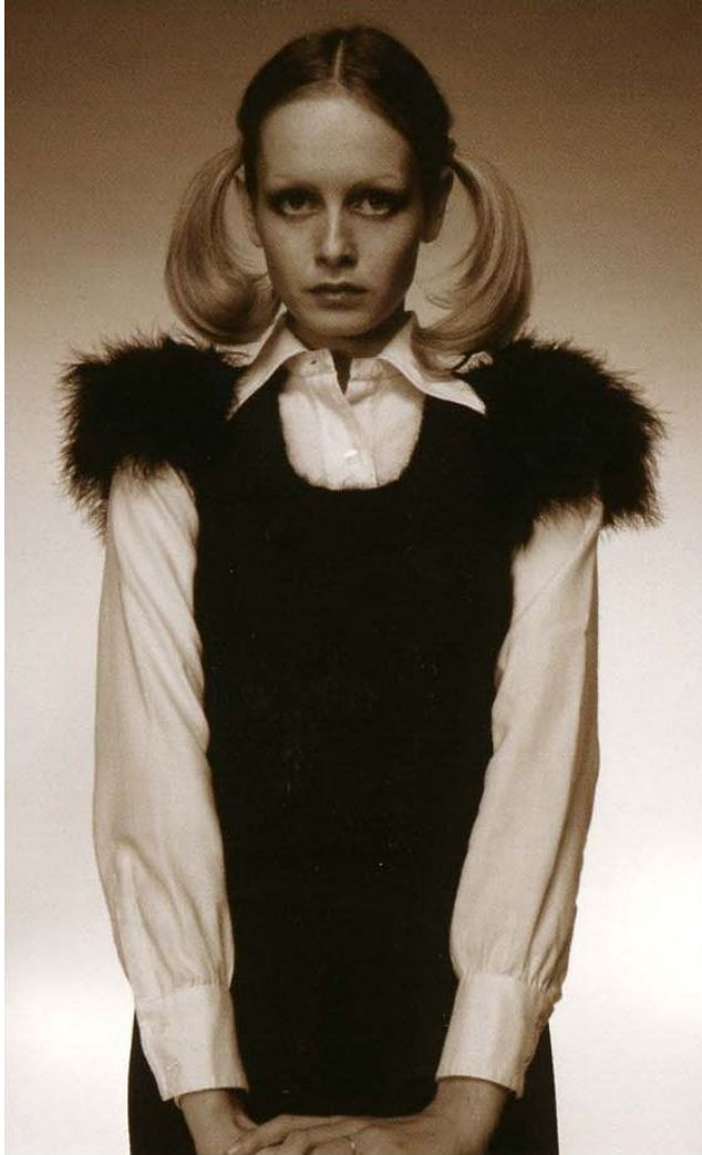
1972年に撮られたポートレイトでは、学生のように2つにちょこんと結って。自分で編んだというニットと白いブラウスで、さらに清楚なイメージ