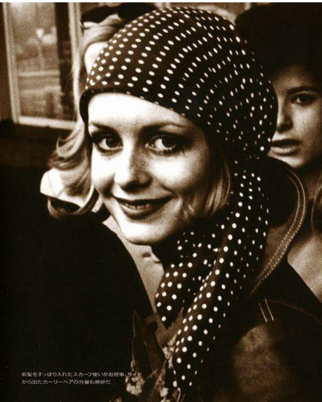
前髪をすっぽり入れたスカーフ使いがお見事。サイドから出たカーリーヘアの分量も絶妙だ