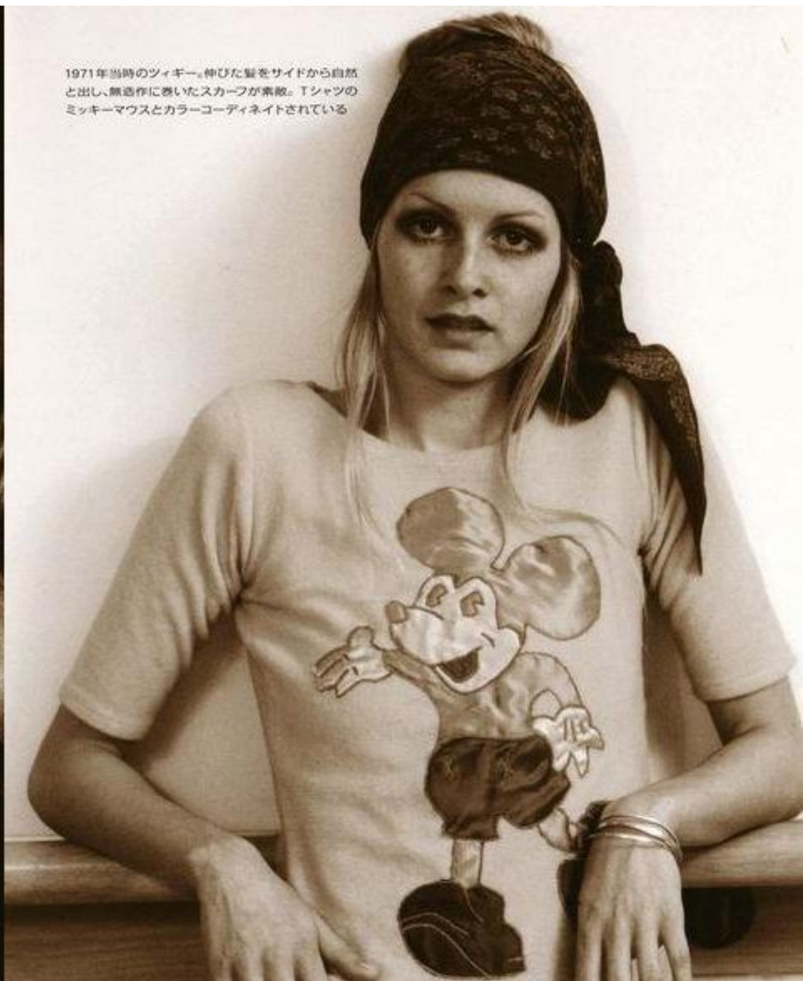
1971年当時のツィギー。伸びた髪をサイドから自然と出し、無造作に巻いたスカーフが素敵。Tシャツのミッキーマウスとカラーコーディネートされている